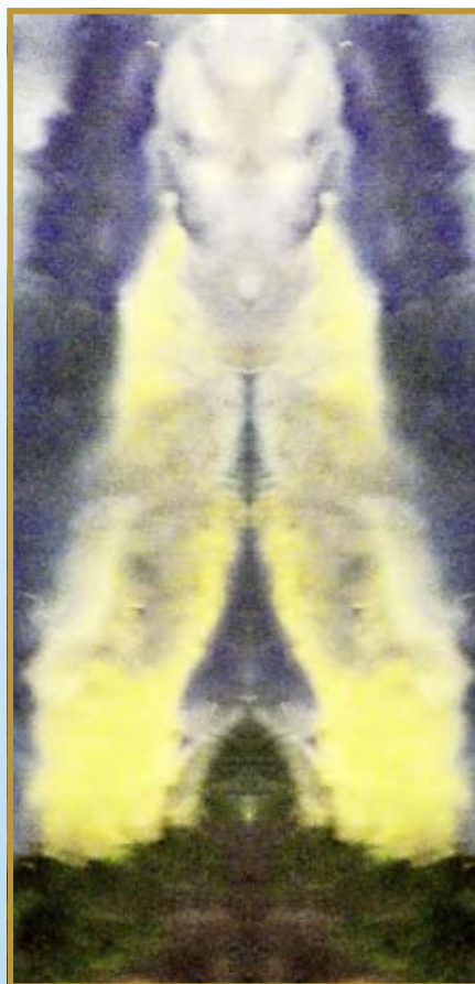
■ A Fényörvény című festmény tükrözésekor a Nagymester oltalmában álló sztúpa válik láthatóvá

További képek és információk: www.natrepinter.com , www.szepesmariaalapitvany.hu