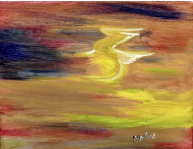
■ Egy személyes beszélgetés alapján született a Pegazus című kép. Utólag derült ki, hogy az illető és ősei táltosok

is. A feladatom az volt, hogy mindennap délután fél háromtól három képet rajzoljak szénrel. Pünkösdkor újabb égi „utasítást” kaptam: próbáljam